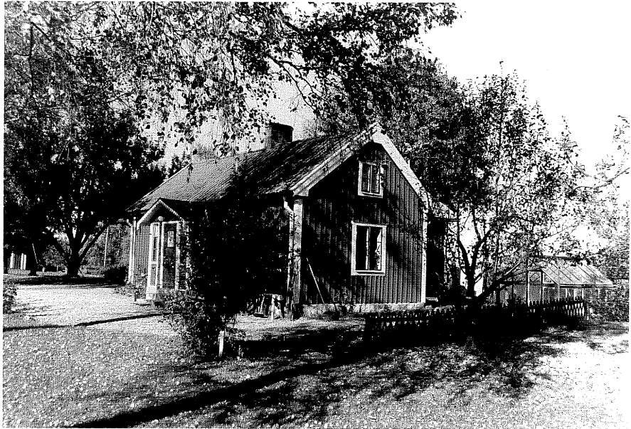
Neg nr ÖKM 08:19 Bostadshus från S0 byggnad a

Ödeshögs kommun Svanshals socken Svanshals 6:4 Sjöhem