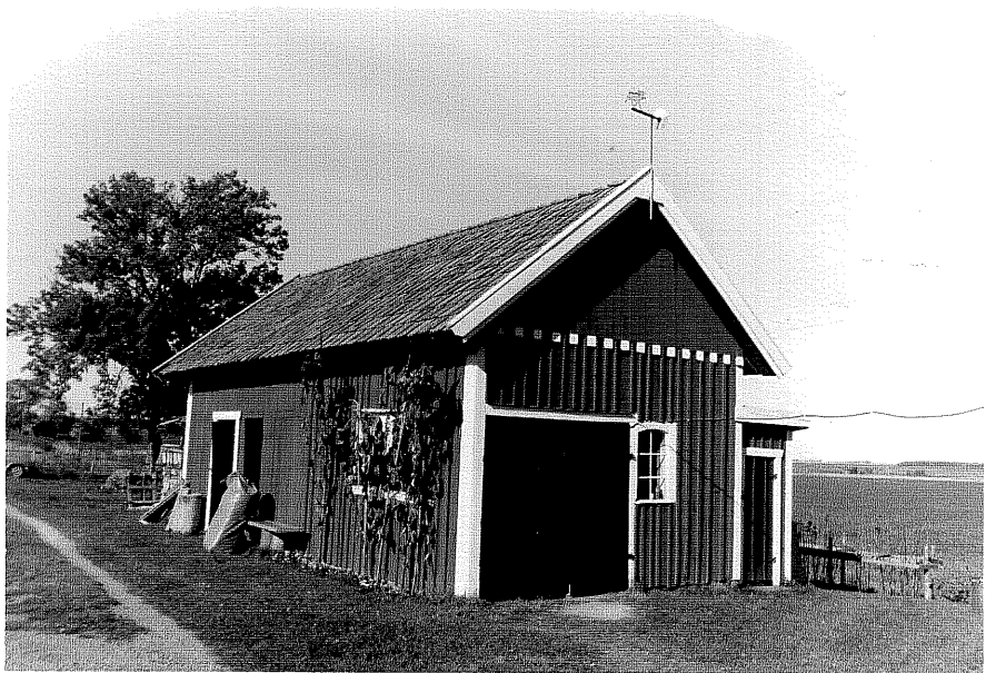
Neg nr ÖKM 08:23 Vedbod från Ö byggnad b