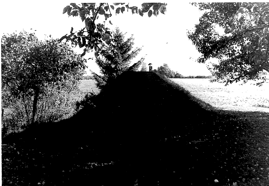
Neg nr ÖKM 08:16 Jordkällare från SV byggnad d