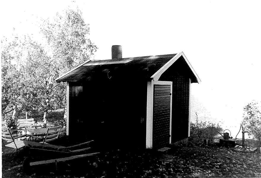
Neg nr ÖKM 08:21 Uthus från SO byggnad c

Ödeshögs kommun Svanshals socken Svanshals 6:4 Sjöhem