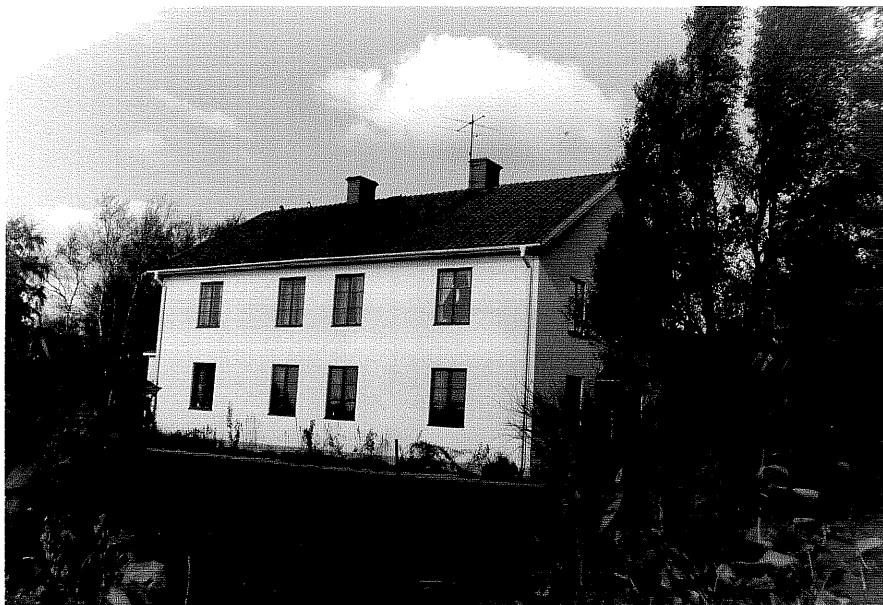
Neg nr ÖKM 10:08 Bostadshus från SO byggnad a