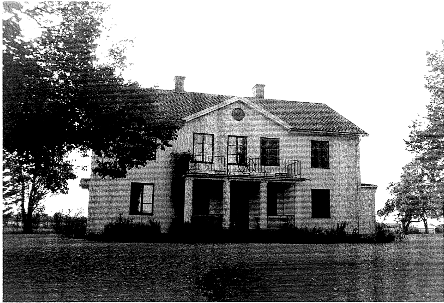
Neg nr ÖKM 10:05 Bostadshus från NO byggnad a

Ödeshögs kommun Svanshals socken Svanshals 6:8