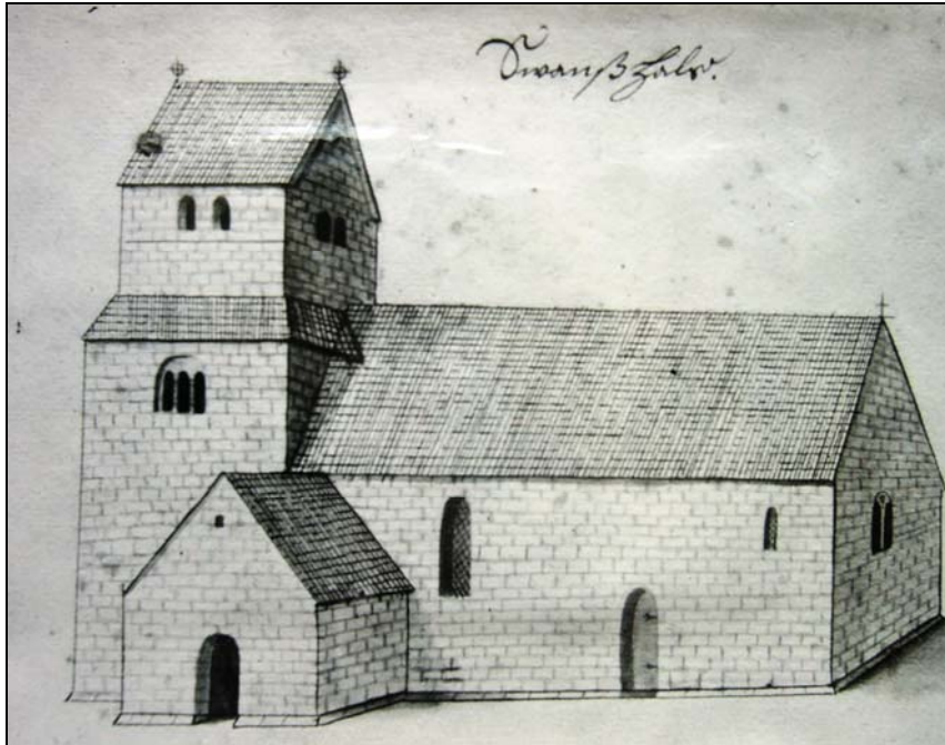
Avbildning av kyrkan från 1670-talet av Elias Brenner.

medeltid. Tornet, varav sannolikt de nedre delarna är bevarade, tillhörde antingen den ursprungliga anläggningen eller tillbyggdes kort därefter. En uppmättningsritning från 1842 visar en tydlig vertikal genomgående skarv mellan tornet och långhuset. Tornet har dessutom en skråhuggen kalkstensockel medan långhuset saknar markerad sockel, vilket kan tyda på att de inte är uppförda vid samma tid. Senare under medeltiden uppfördes ett nytt kor av samma bredd som långhuset och kyrkorummet valvslogs. På korets östvägg ska det ha funnits huggna människohuvud av sten. Under senmedeltid eller under 1600-talet tillbyggdes sakristian.