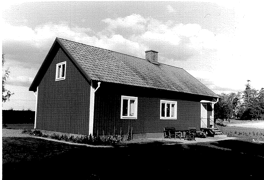
Neg nr ÖKM 09:34 Arbetarebostad från SV Byggnad a

Ödeshögs kommun Svanshals socken Svanshals Mellang 8:1 Arb-bost