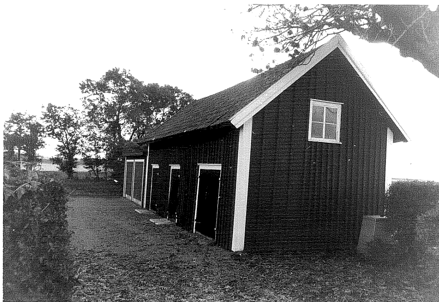
Neg nr ÖKM 10:02 Uthus från N byggnad b