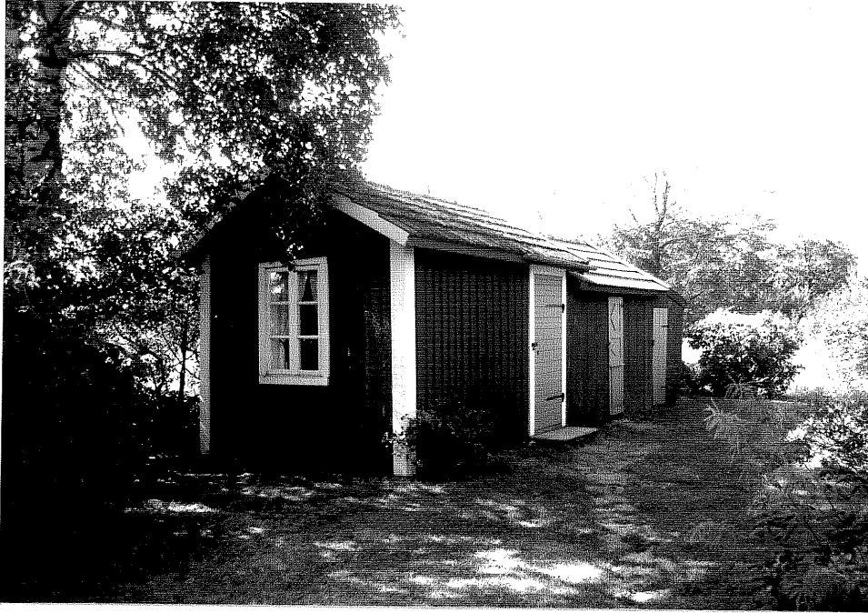
Neg. nr. V.T 06:14 Uthus mot nordost