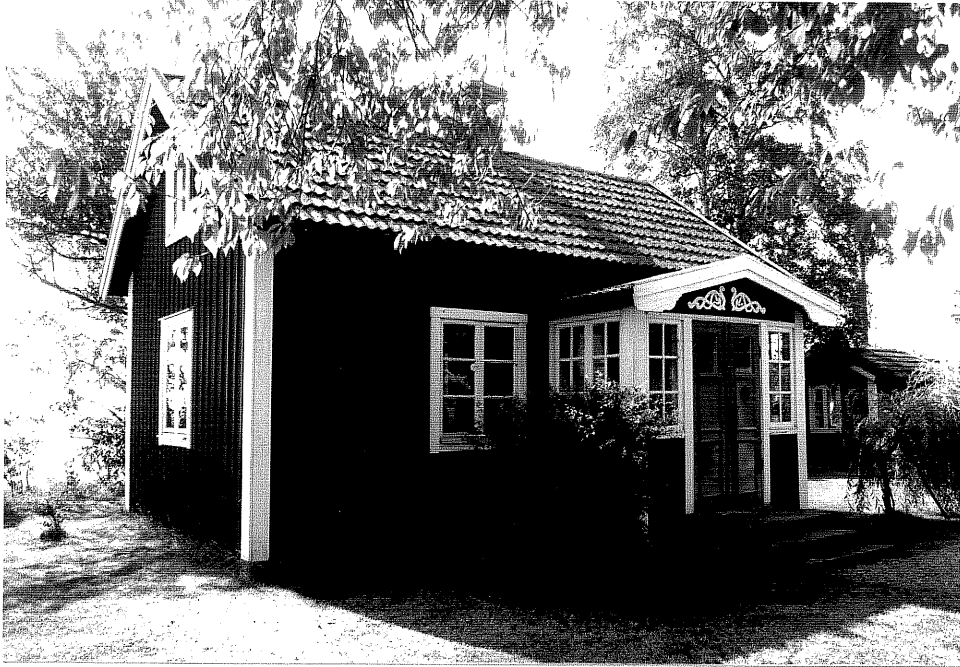
Neg. nr. V.T 06:12 Bostadshuset mot nordost