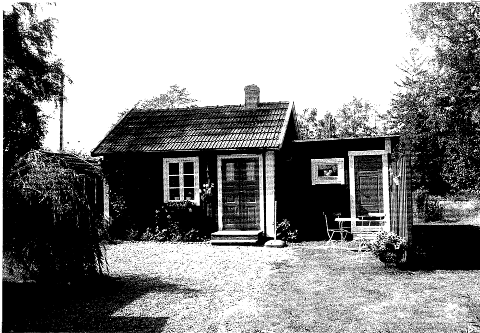
Neg. nr. V.T 06:13 Flygel, lillstugan mot öster