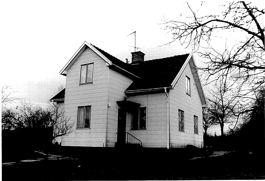
Neg. nr. T 14:04 Svärdsfalla f.d. skola från NO

Ödeshögs kommun Trehörna socken Svärdsfalla 1:2 F.d. skolan