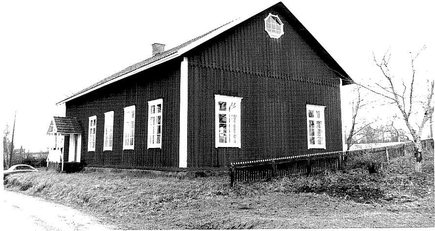
Neg. nr. T 14:05 Missionshuset från NO

Ödeshögs kommun Trehörna socken Svärdsfälla 1:3 Svärdsfälla missionshus