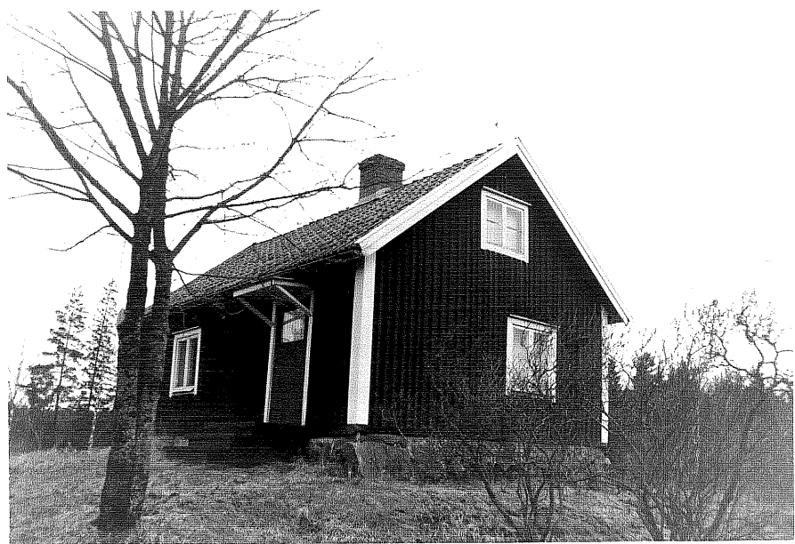
Neg. nr. T 15:21 "Gamla" bostadshuset från SO