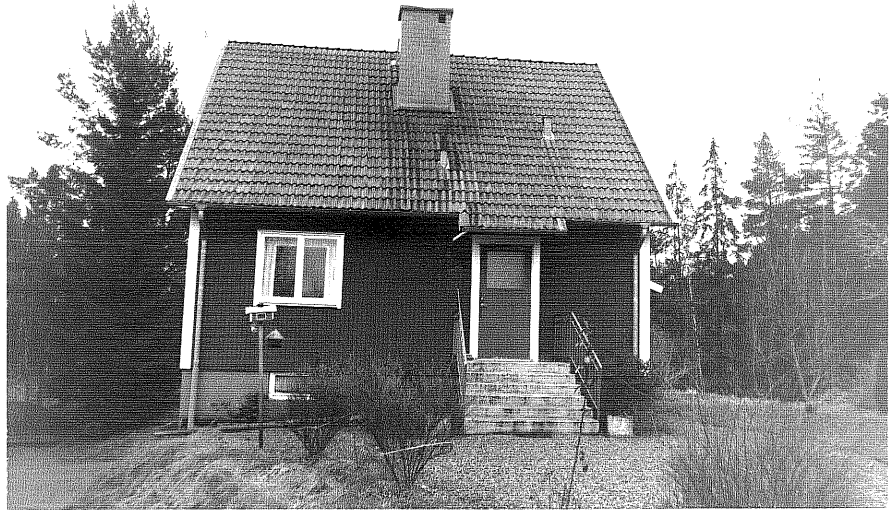
Neg. nr. T 15:20 "Nya" bostadshuset från N

Ödeshögs kommun Trehörna socken Svärdsfalla 1:6 Kullen