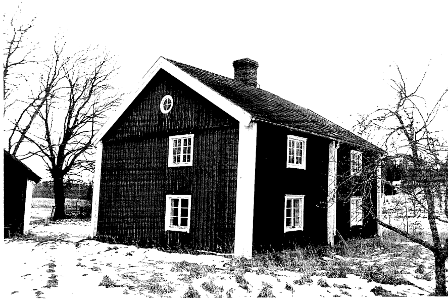
Neg. nr. T 13:10 Svärdstorp från NV

Ödeshögs kommun Trehörna socken Svärdstorp 1:1