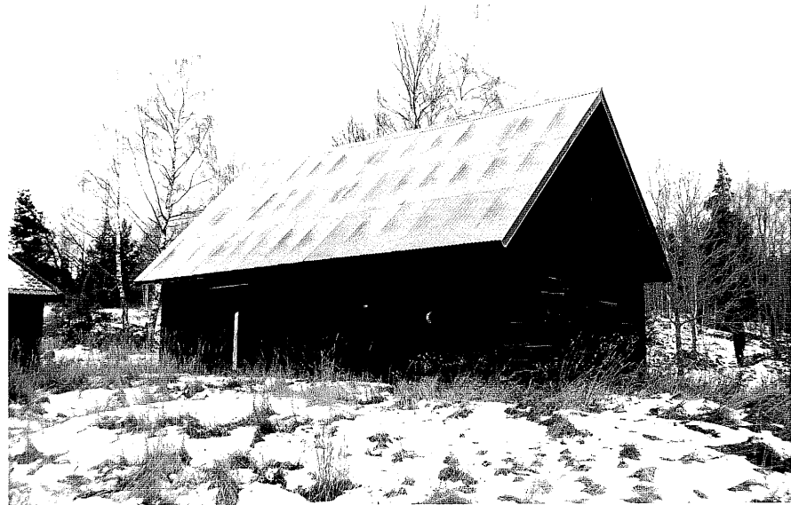
Neg. nr. T 13:11 Magasin från S0