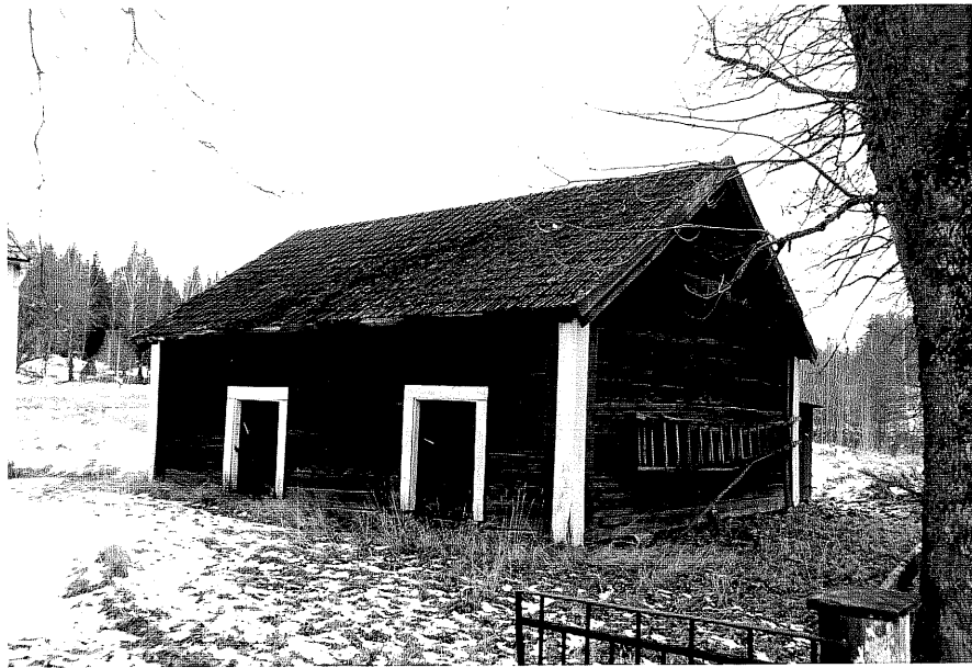
Neg. nr. T 13:07 Flygelbod från S0