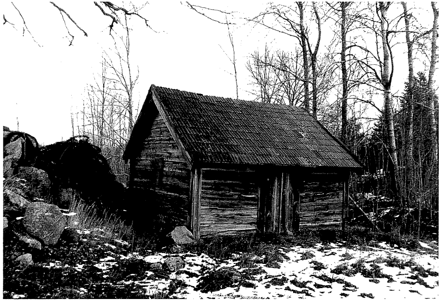
Neg. nr. T 13:14 Smedjan från V