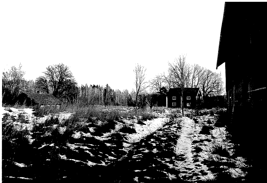
Neg. nr. T 13:12 Svärdstorp i miljön från V

Ödeshögs kommun Trehörna socken Svärdstorp 1:1