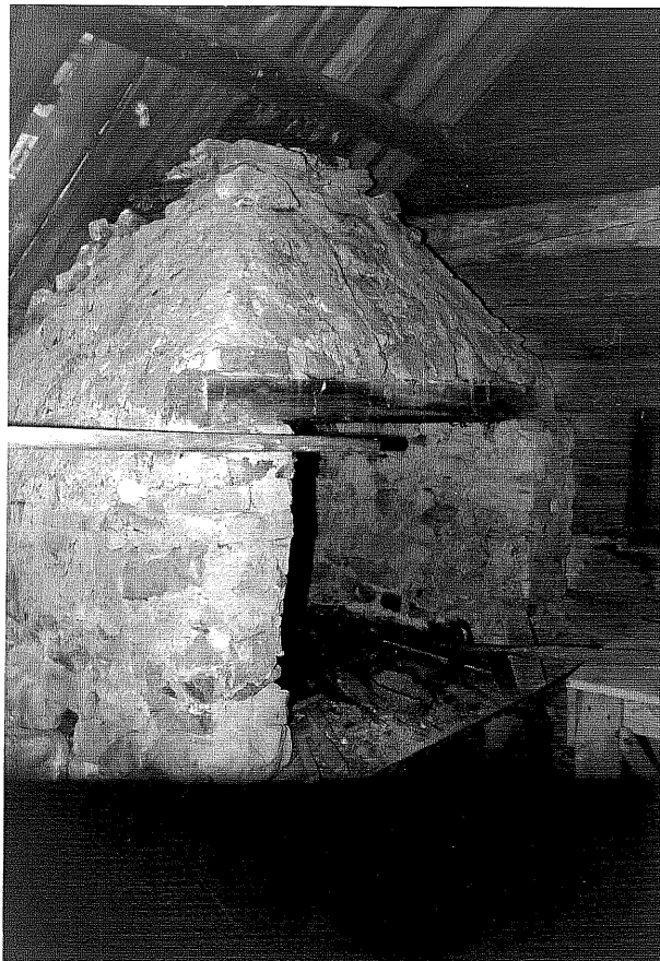
Neg. nr. T 13:15 Härden i smedjan