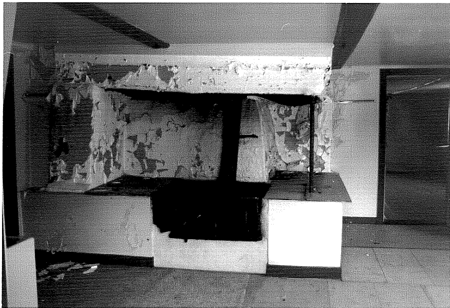
Neg. nr. T 13:09 Köket från N