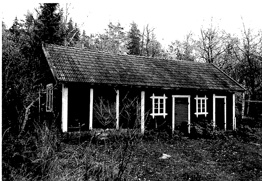
Neg. nr. T 01:09 Uthus från NV