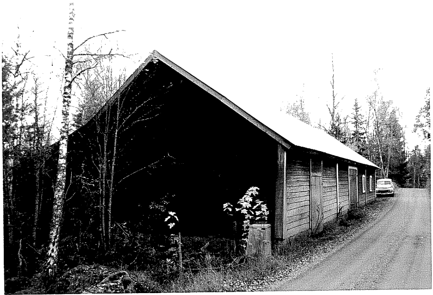
Neg. nr. T 01:14 Ladugården från O