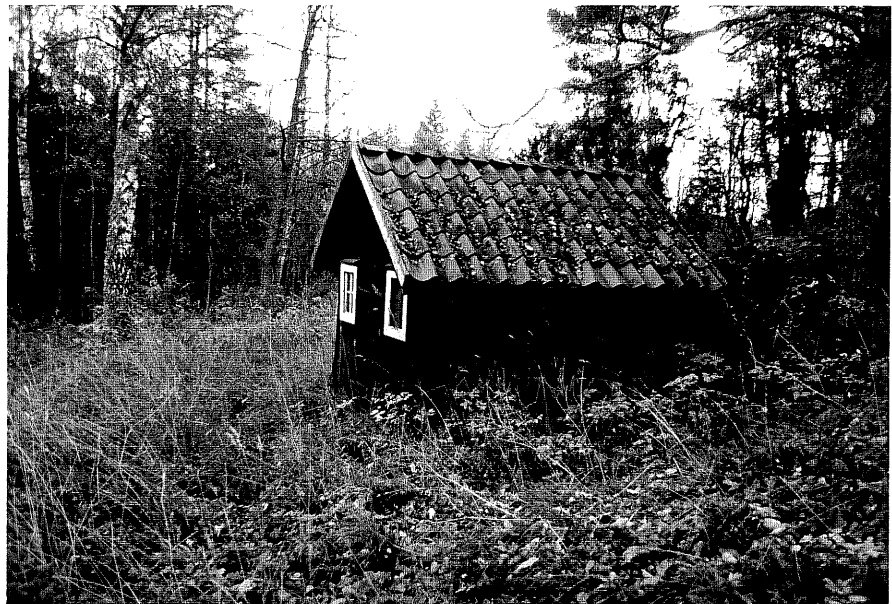
Neg. nr. T 01:12 Mjölkkällare från N