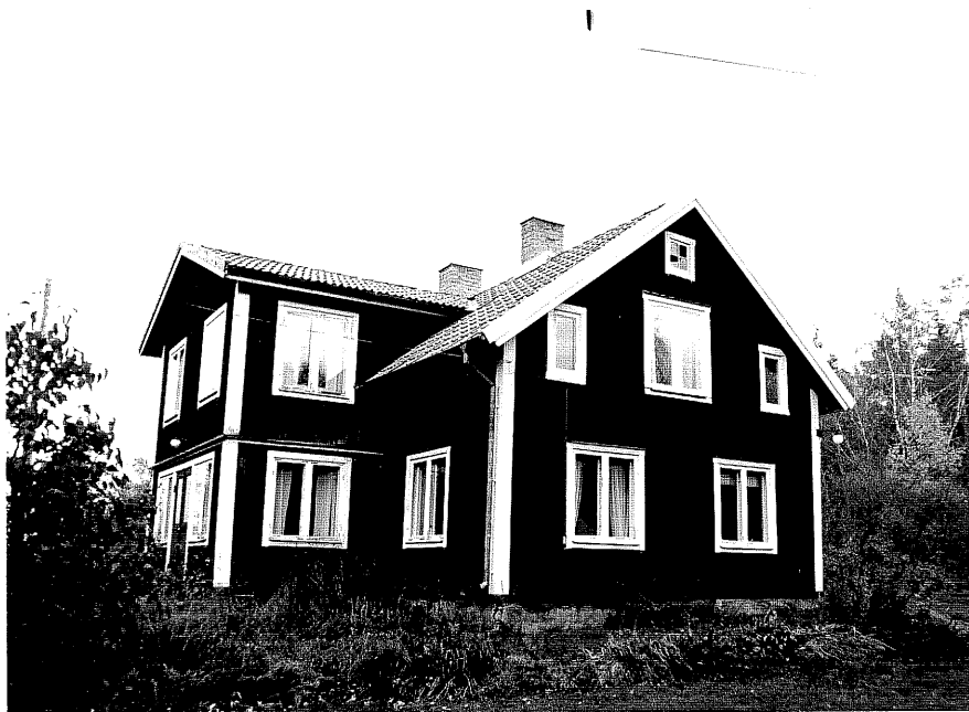
Neg. nr. T 01:10 Bostadshuset från SV