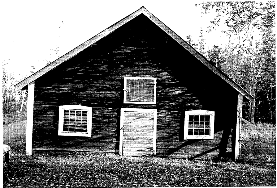
Neg. nr. T 01:17 Ladugården från V