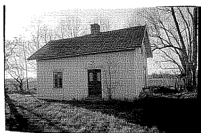
Bostadshus från NO