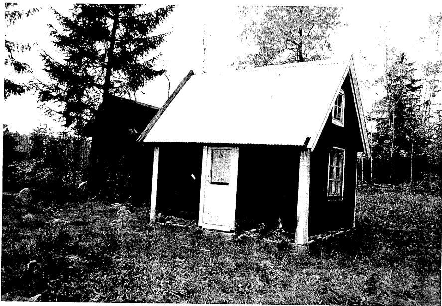
Neg. nr. T 01:19 Uthus från SO