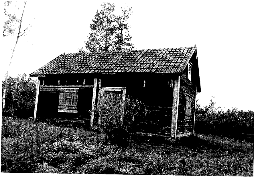
Neg. nr. T 01:18 Torpet från NO

Ödeshög kommun Trehörna socken Tjuvakärret 2:4