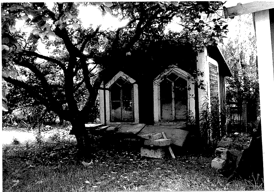
Neg. nr. V.T 01:3 Redskapsbod mot norr

Ödeshögs kommun V:a Tollstad socken Tollstad 2 10 "Karlsro" Hamngatan 1