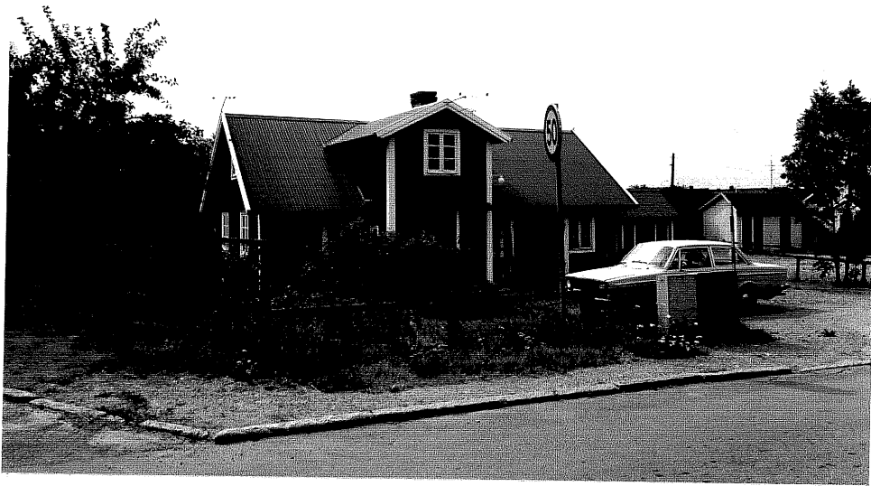
Neg. nr. V.T 01:1 Bostadshuset mot nordost

Ödeshögs kommun V:a Tollstad socken Tollstad 2 10 "Karlsro" Hamngatan 1