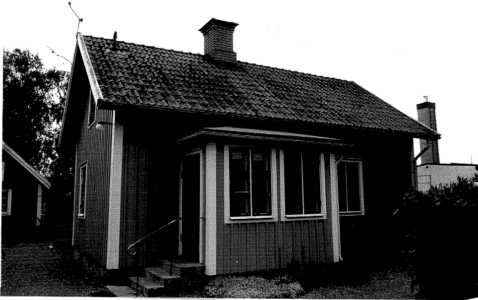
Neg. nr. V.T 01:11 Bostadshuset mot nordväst

Ödeshögs kommun V:a Tollstad socken Tollstad 2 12 Hamngatan