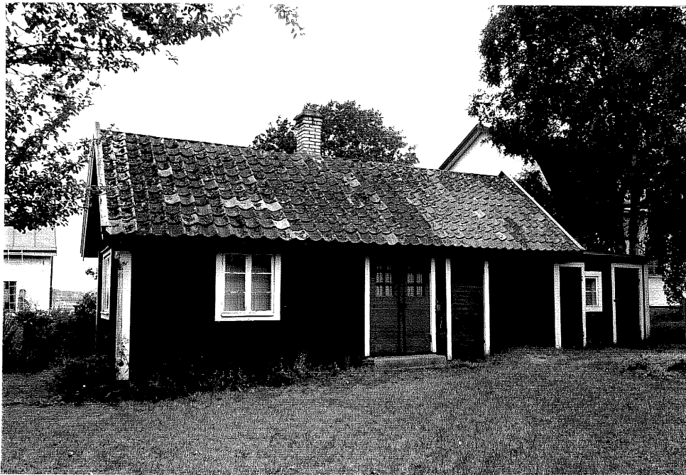
Neg. nr. V.T 01:12 Uthus mot söder