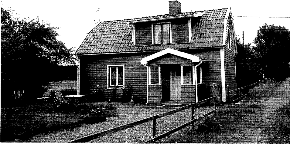
Neg. nr. V.T 04:19 Bostadshus mot sydost

Ödeshögs kommun V:a Tollstad socken Tollstad 2 13 Ängsbovägen