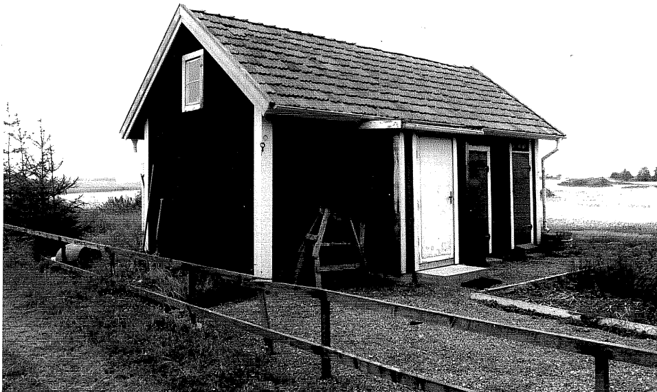
Neg. nr. V.T 04:18 Uthus mot nordost