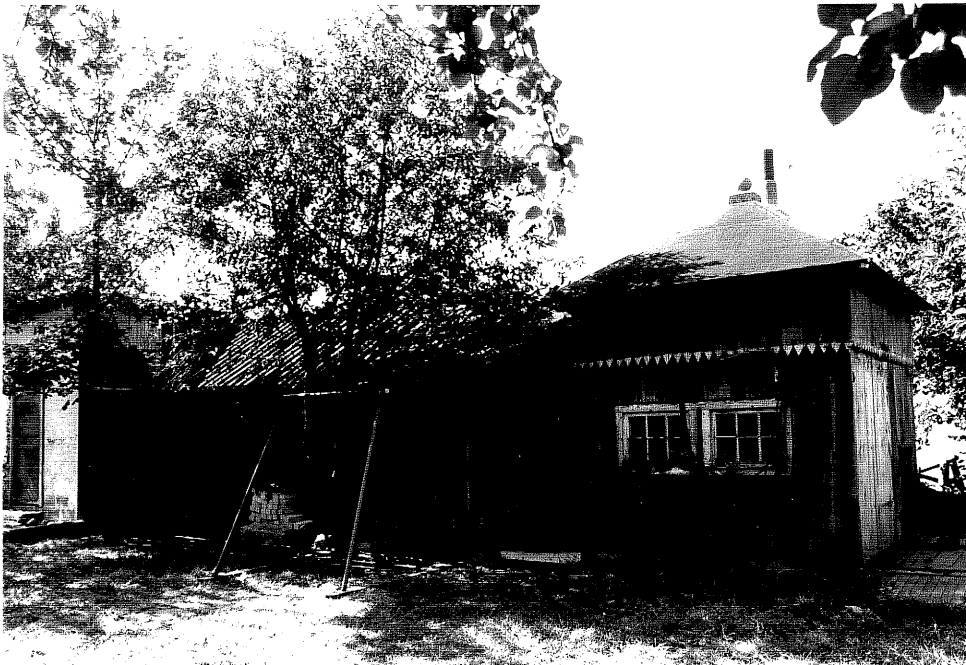
Neg. nr. V.T 02:4 Uthus mot öster