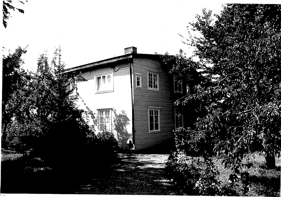
Neg. nr. V.T 02:3 Bostadshus mot nordost

Ödeshögs kommun V:a Tollstad socken Tollstad 2 15 Tägnegatan 6