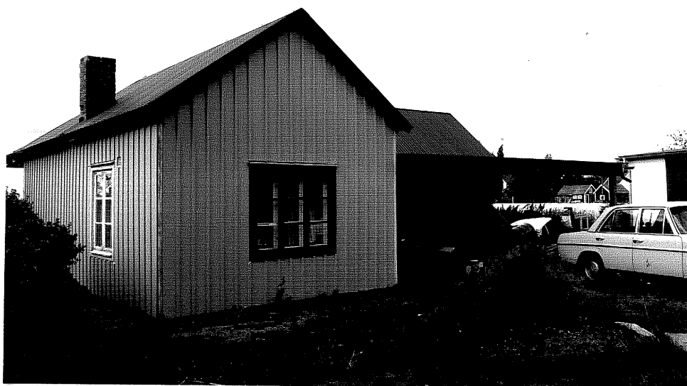
Neg. nr. V.T 02:1 Uthus mot öster