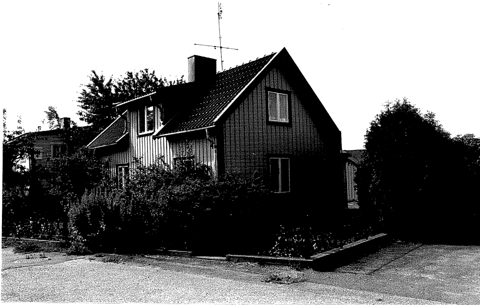
Neg. nr. V.T 02:2 Bostadshus mot nordost

Ödeshögs kommun V:a Tollstad socken Tollstad 2 16 Tägnegatan 4