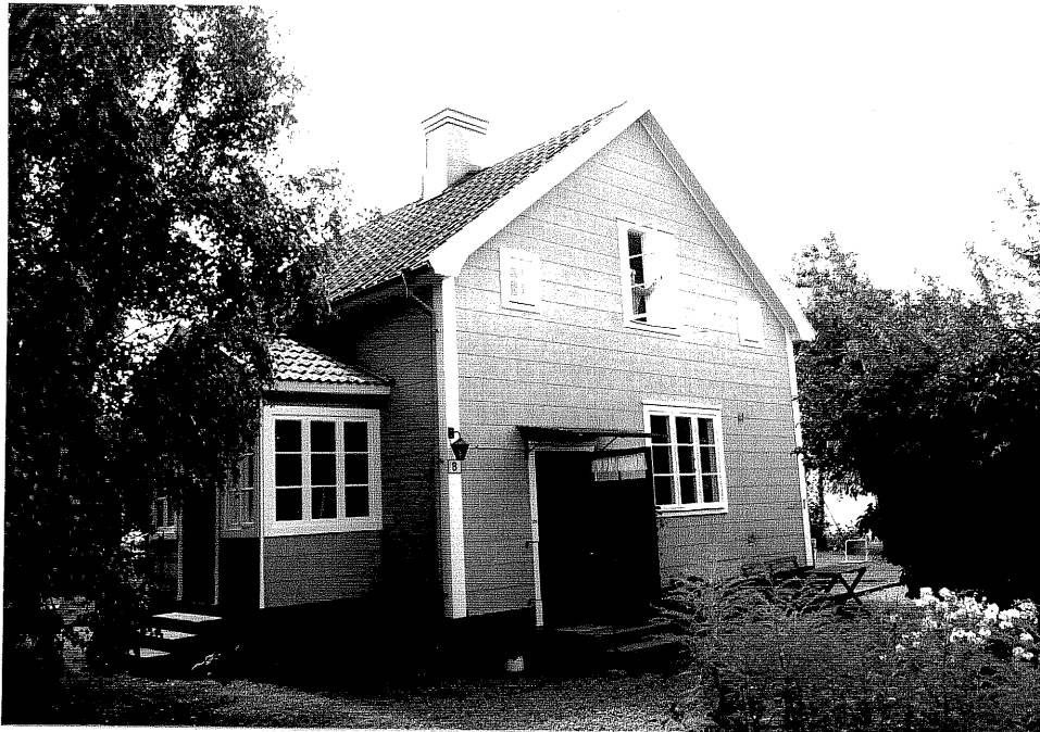
Neg. nr. V.T 02:6 Fastigheten mot nordost

Ödeshögs kommun V:a Tollstad socken Tollstad 2 18 Tägnegatan 8