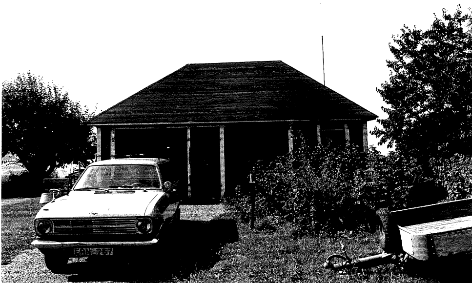
Neg. nr. V.T 02:8 Uthus mot öster