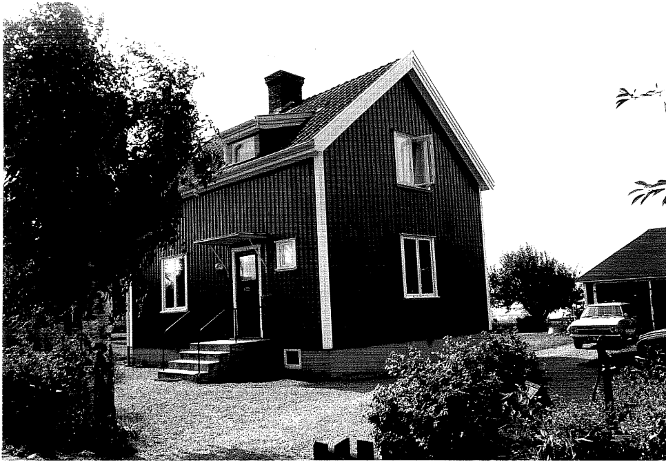
Neg. nr. V.T 02:7 Fastigheten mot nordost

Ödeshögs kommun V:a Tollstad socken Tollstad 2 19 Tägnegatan 10