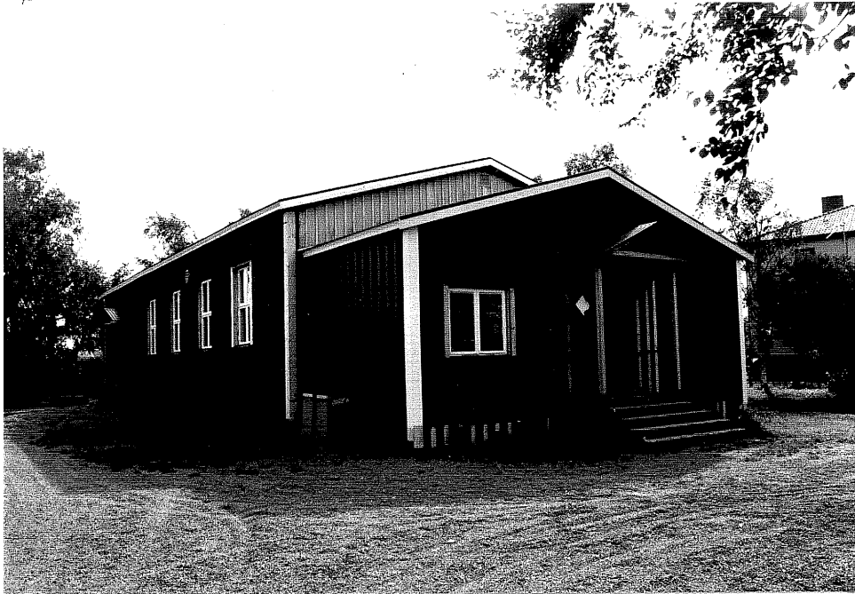
Neg. nr. V.T 01:33 Bydegården mot nordväst.

Ödeshögs kommun V:a Tollstad socken Tollstad 2 20 Tägnegatan 3