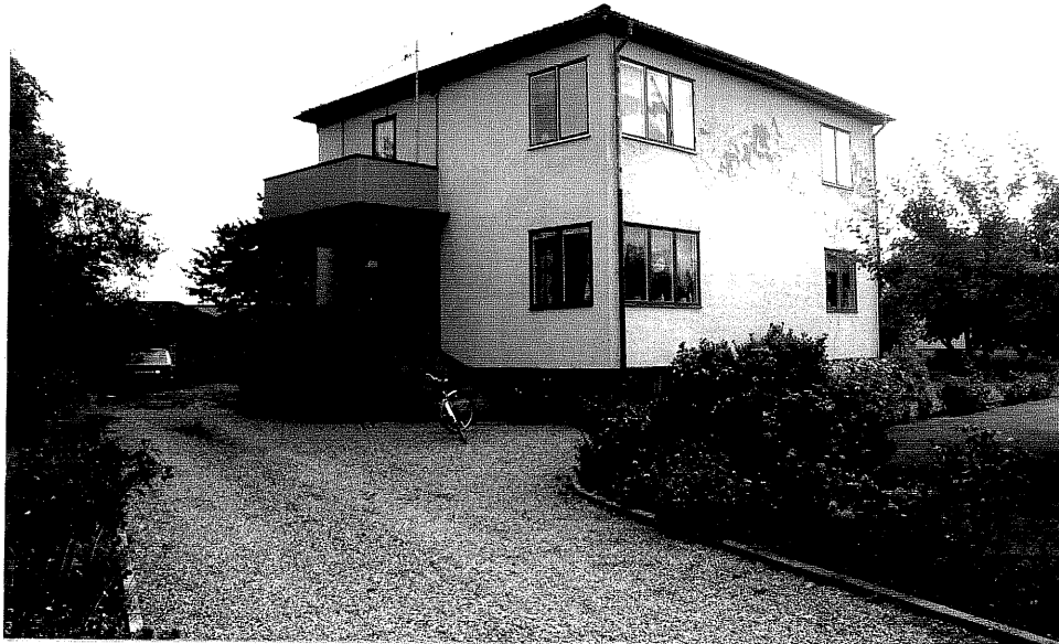
Neg. nr. V.T 01:36 Tvåfamiljshus mot nordväst

Ödeshögs kommun V:a Tollstad socken Tollstad 2 22 Tägnegatan 5