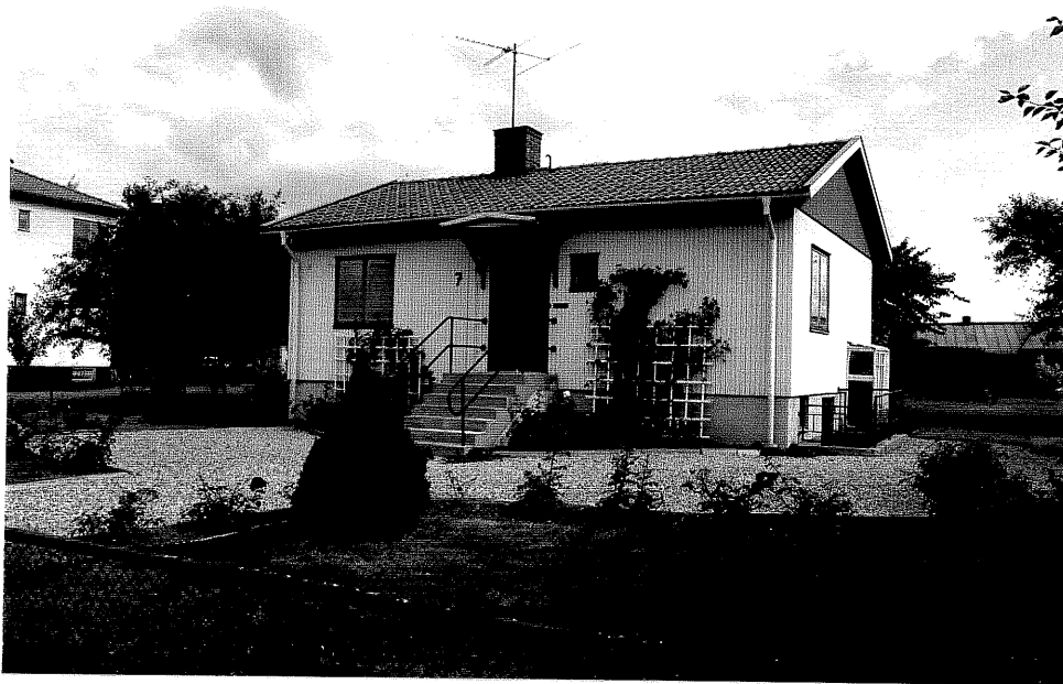
Neg. nr. V.T 02:12 Bostadshuset mot sydväst

Ödeshögs kommun V:a Tollstad socken Tollstad 2 24 Tägnegatan 7