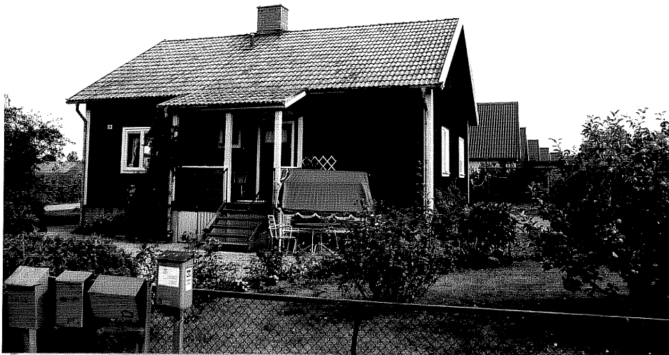
Neg. nr. V.T 02:10 Bostadshuset mot sydväst

Ödeshögs kommun V:a Tollstad socken Tollstad 2 26 Tägnegatan 11