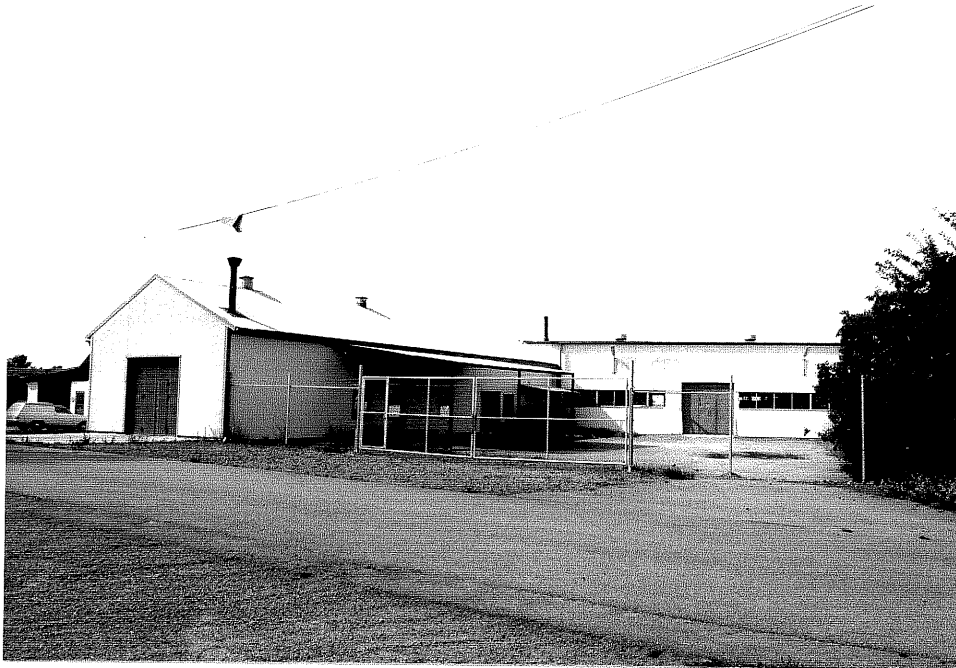
Neg. nr. V.T 01:34 Fabriken mot nordost

Ödeshögs kommun V:a Tollstad socken Tollstad 2 27 Tägnegatan 2