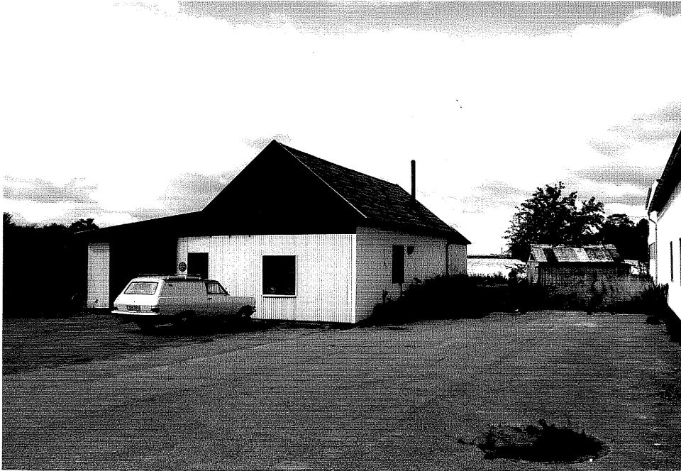
Neg. nr. V.T 01:35 Verkstadslokal mot nordost

Ödeshögs kommun V:a Tollstad socken Tollstad 2 28 Tägnegatan 4