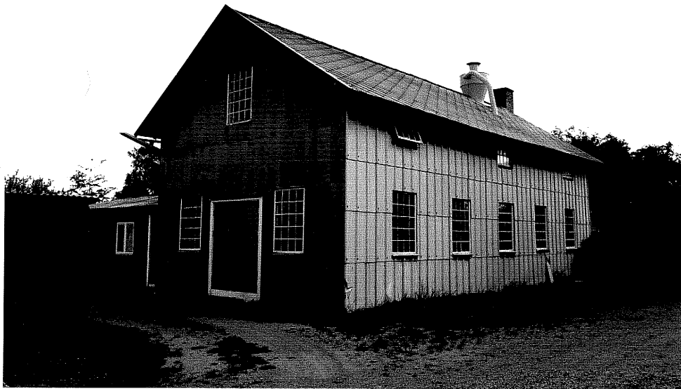
Neg. nr. V.T 01:30. Möbelfabriken mot sydväst.

Ödeshögs kommun V:a Tollstad socken Tollstad 2 7 Tägnegatan 1