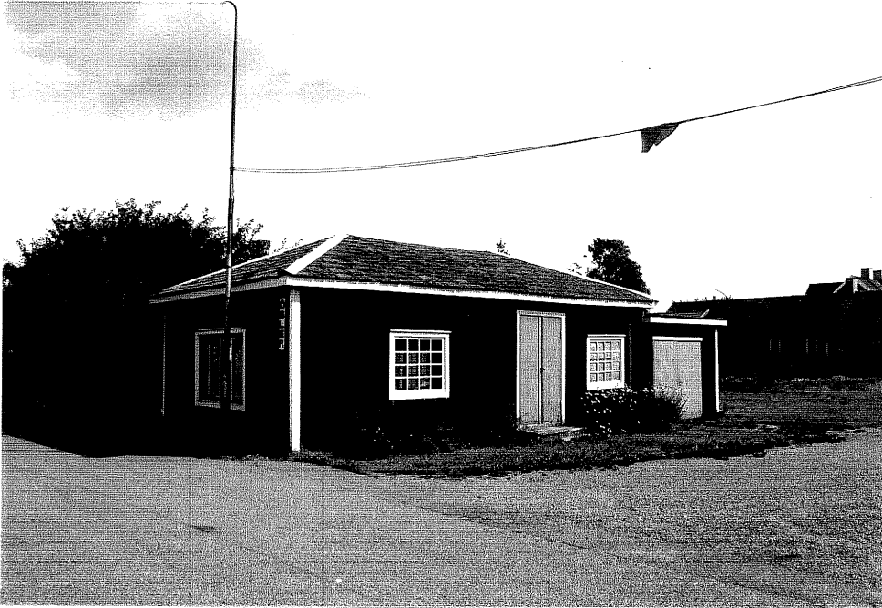
Neg. nr. V.T 01:31 Uthus mot sydväst

Ödeshögs kommun V:a Tollstad socken Tollstad 2 7