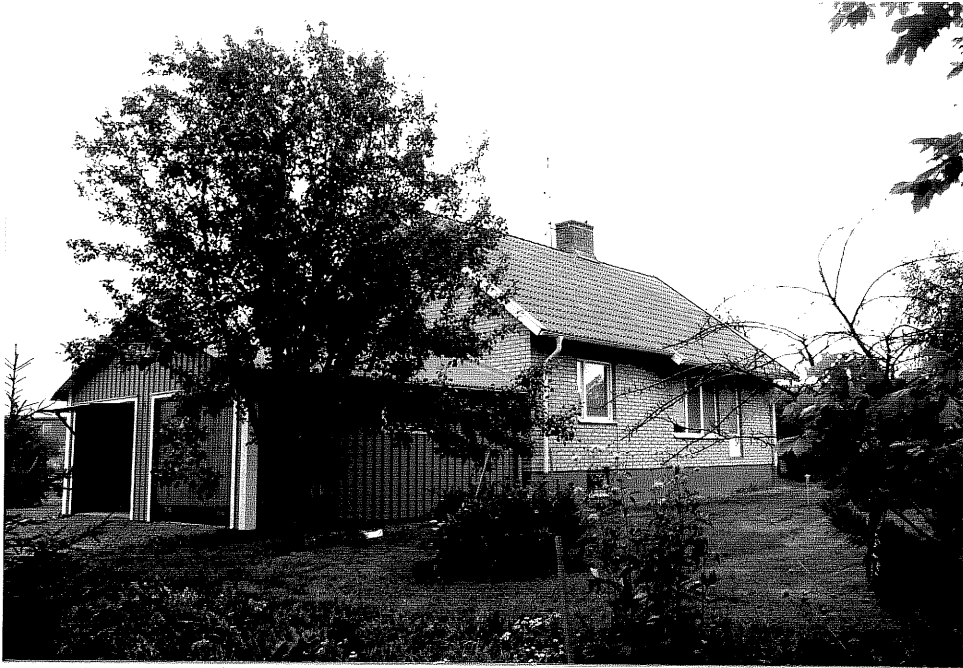
Neg. nr. V.T 01:15 Bostadshuset mot sydväst

Ödeshögs kommun V:a Tollstad socken Tollstad 6 10 Birgittavägen 4