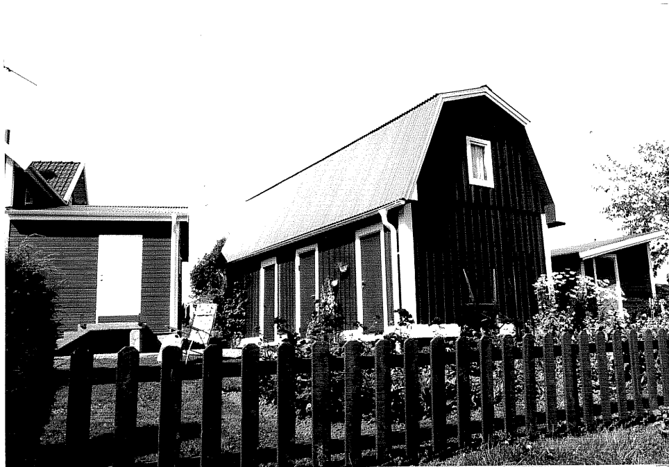
Neg. nr. V.T 03:23 Uthus mot öster