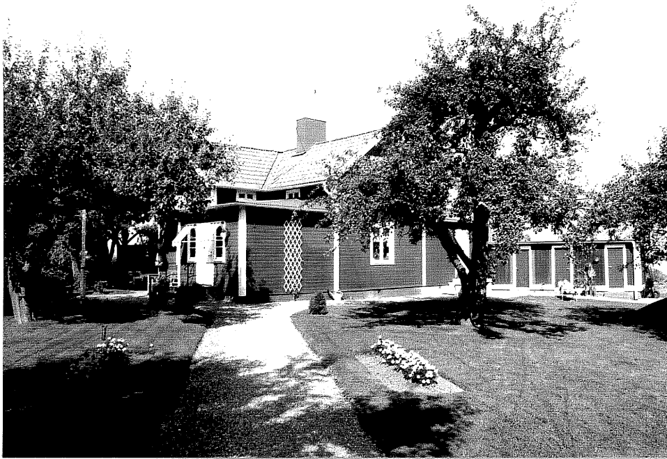
Neg. nr. V.T 03:22 Bostadshus mot sydost

Ödeshögs kommun V:a Tollstad socken Tollstad 6 2 Lastbergsvägen 11