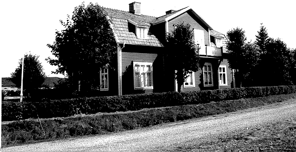
Neg. nr. V.T 03:20 Bostadshus mot sydväst

Ödeshögs kommun V:a Tollstad socken Tollstad 6 3 Villa Vik Lastbergsvägen 2