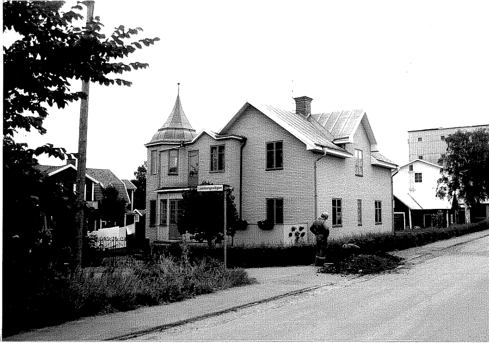
Neg. nr. V.T 04:9 Bostadshuset mot sydväst

Ödeshögs kommun V:a Tollstad socken Tollstad 6 6 Hamngatan 26