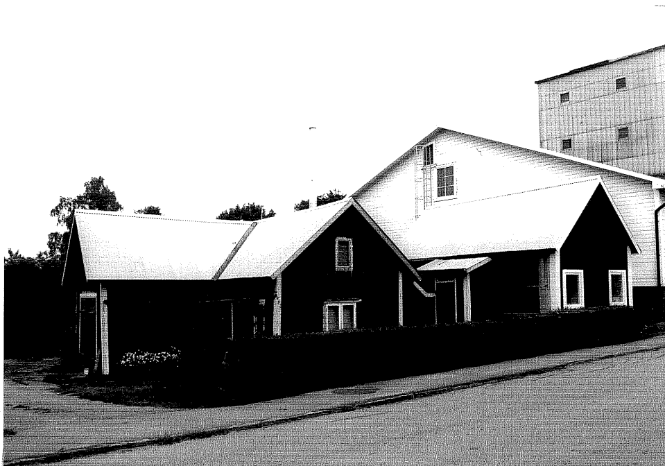
Neg. nr. V.T 04:6 Uthus mot söder