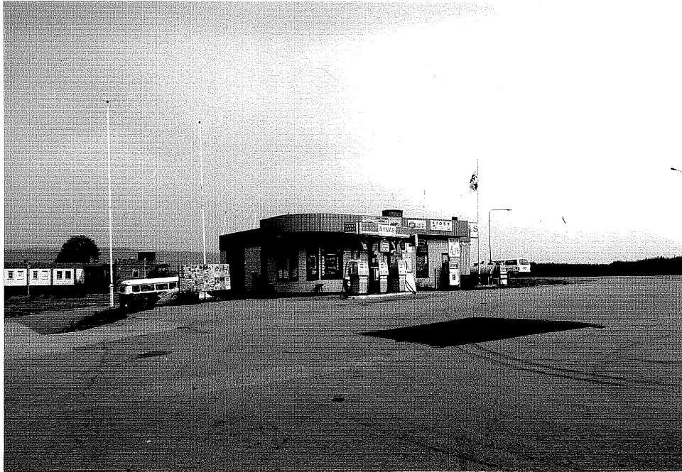
Neg. nr. V.T 01:0 Bensinstationen mot söder

Ödeshögs kommun V:a Tollstad socken Tollstad 6 7 Hamngatan 2 Bensinstation