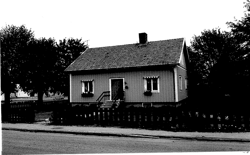
Neg. nr. V.T 01:6 Bostadshuset mot sydost

Ödeshögs kommun V:a Tollstad socken Tollstad 6 8 Birgittavägen 2