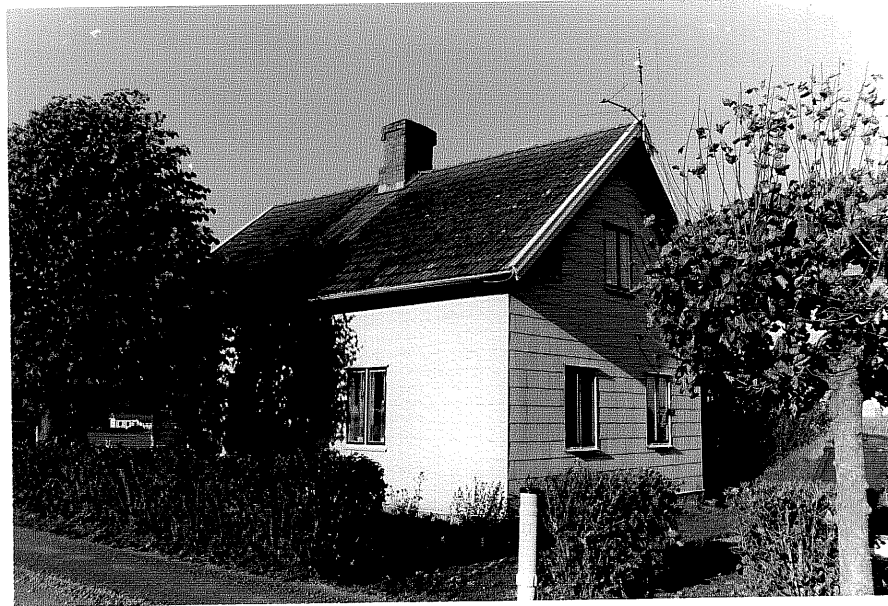
Neg nr ÖKM 11:29 Bostället från SV Byggnad a

Ödeshögs kommun V Tollstads socken Tollstad Prästgård 1:1