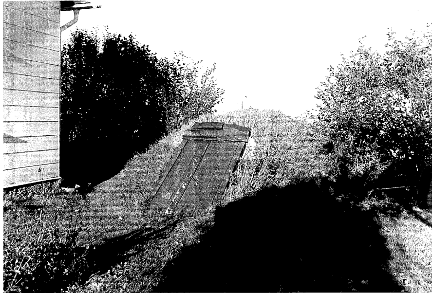
Neg.nr ÖKM 11:32 Jordkällare från SV Byggnad c

Ödeshögs kommun Västra Tollstad socken Västra Tollstad Prästgård 1:1