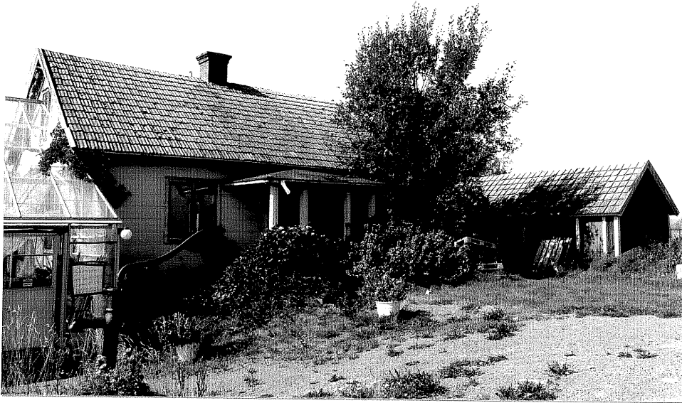
Neg. nr. V.T 06:8 Bostadshus mot sydost