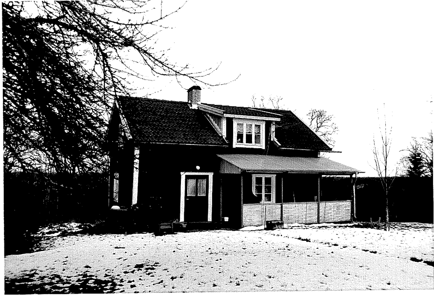
Neg. nr. T 13:06 Torpet Lindeberg från SV

Ödeshögs kommun Trehörna socken Trehörna 1:1 Lindeberg