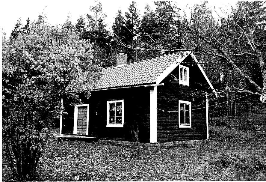
Ne. nr. T 06:27 Torpet från SO

Ödeshög kommun Trehörne socken Trehörna 1:1 Torpet Nyhagen