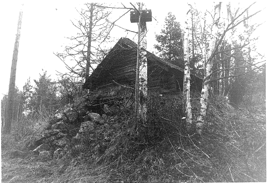
Neg. nr. T 15:15 Källarbod från SV