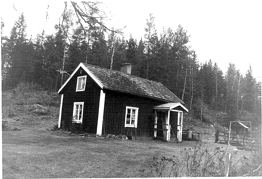
Neg. nr. T 15:13 Torpet från SO

Ödeshögs kommun Trehörna socken Trehörna 1:1 Skogäng