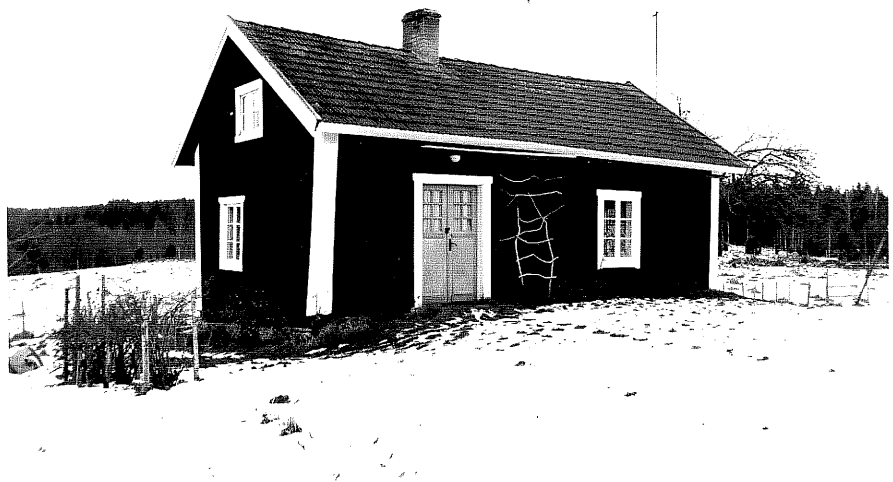
Neg. nr. T 13:02 Svartarp från SV