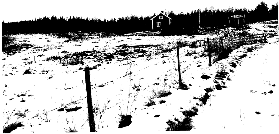
Neg. nr. T 13:01 Svartarp i miljön från V

Ödeshögs kommun Trehörna socken Trehörna 1:1 Svartarp