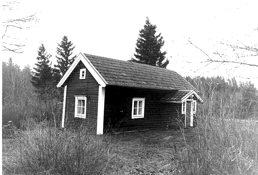
Neg. nr. T 15:19 Timrad gäststuga från NV