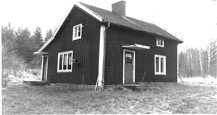
Neg. nr. T 15:18 Huvudbyggnaden från SV