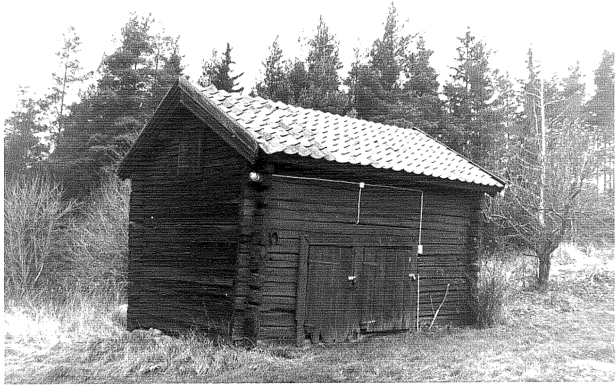
Neg. nr. 15:17 Dubbelbod från S0

Ödeshögs kommun Trehörna socken Trehörna 1:1 Svartgölen