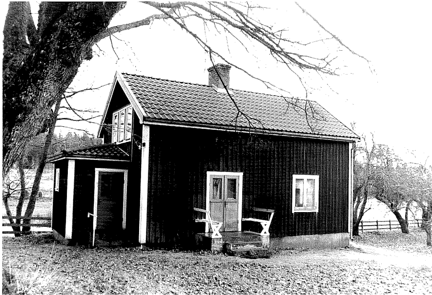
Neg. nr. T 14:34 "Nya" bostadshuset från NV

Ödeshögs kommun Trehörna socken Trehörna 1:1 Älggölen