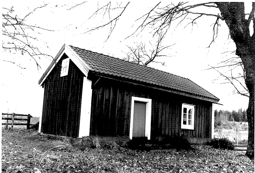
Neg. nr. T 14:35 Gamla bostadshuset från SV