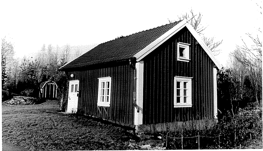
Neg. nr. T 11:17 Torpet från 0

Ödeshögs kommun Trehörna socken Trehörna 1:1 Torp väster om Löverhult