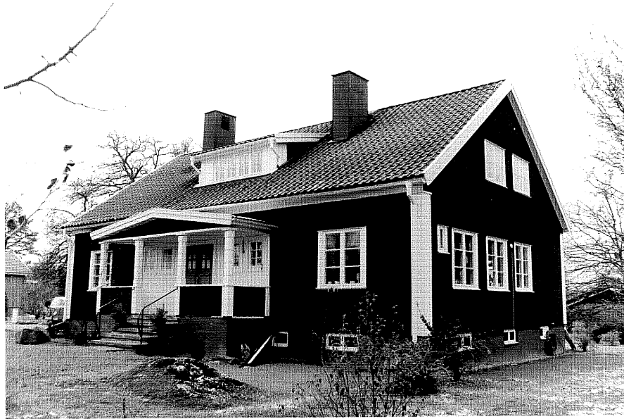
Neg. nr. T 11:19 F.d. ålderdomshemmet från NO

Ödeshögs kommun Trehörna socken Trehörna 1:28 Nya ålderdomshemmet