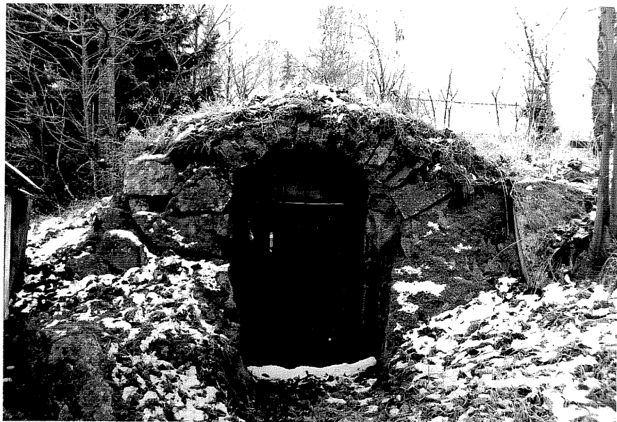
Neg. nr. T 11:14 Jordkällare från NO