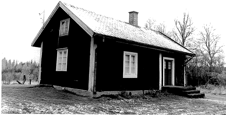
Neg. nr. T 11:15 Ålabäcken från SO

Ödeshögs kommun Trehörna socken Trehörna 1:47 Ålabäcken