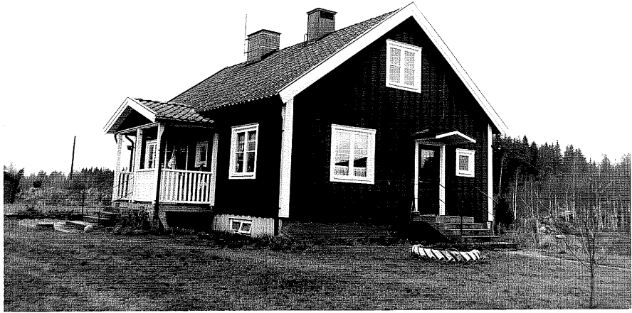
Neg. nr. T 15:12 Bostadshuset från SÖ

Ödeshögs kommun Trehörna socken Trehörna 1:76 Gård S Skogäng