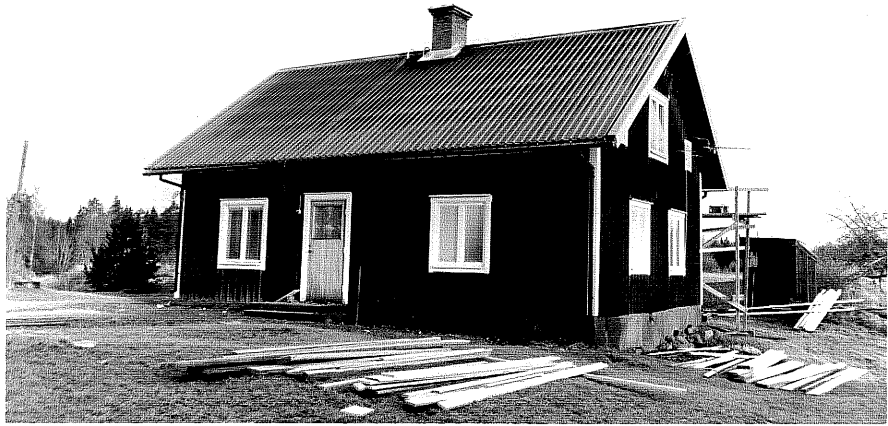
Neg. nr. T 11:16 Löverhult från S

Ödeshögs kommun Trehörna socken Trehörna 1:78 Löverhult