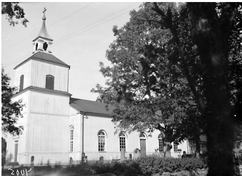
Trehörna kyrka 1939. Foto i ÖLM:s arkiv.

ÖLM – Östergötlands länsmuseums topografiska arkiv