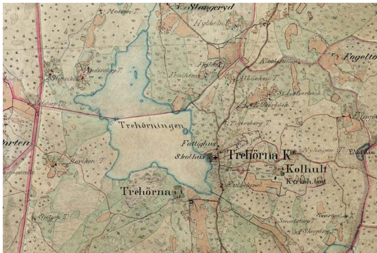
Utsnitt ur Häradsekonomska karta 1868-1877