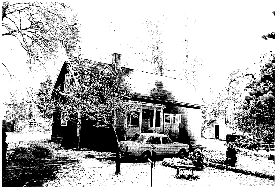
Neg. nr. T 07:31 Bostadshuset från S