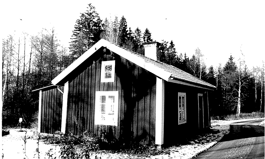
Neg. nr. T 07:32 Norra huset från SO