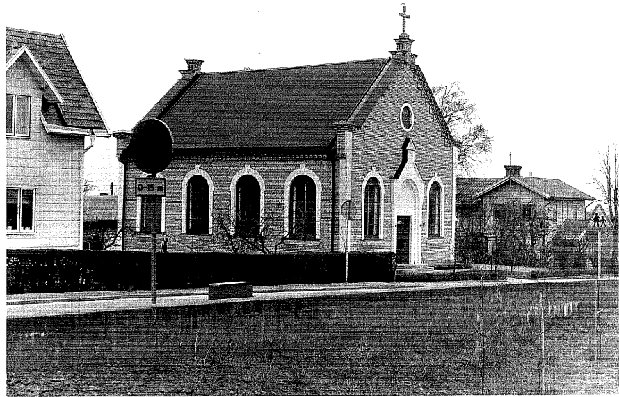
Korskyrkan a fr. SO,4:14.

Ödeshög sn Tulpanen 1 Järnvägsgatan 7 foto:M.Wikdahl,1978.