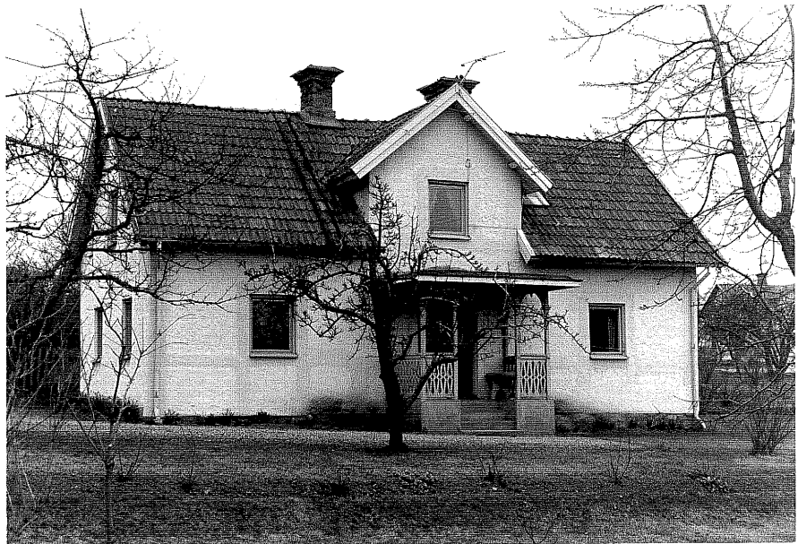
Gårdshus b fr. N, 4:24.