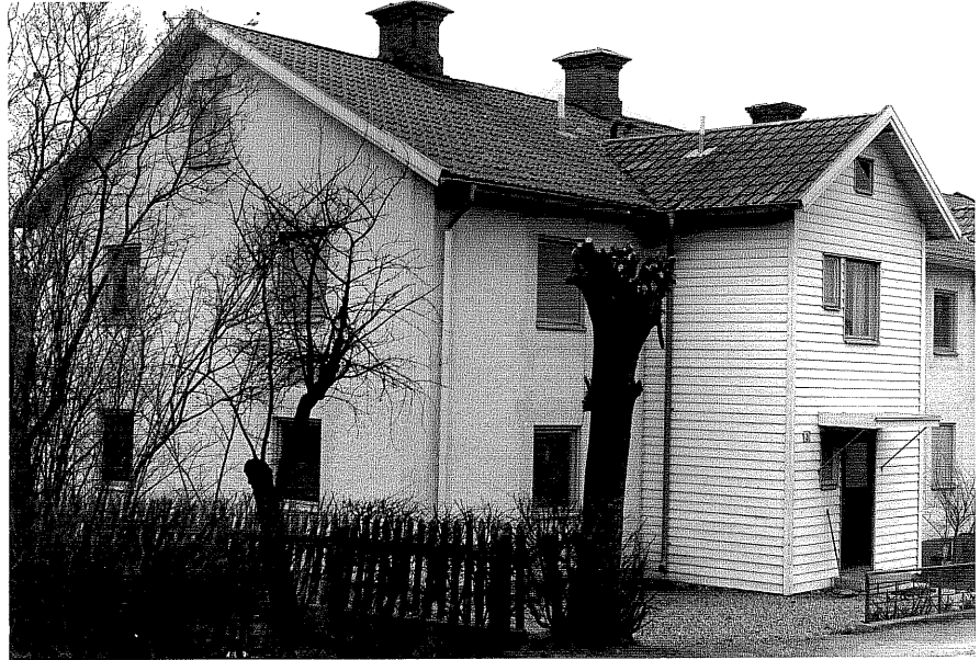
Bostadshus a fr. 50, 4:19.

Ödeshög sn Tulpanen 11 Järnvägsgatan 3 foto:M.Wikdahl,1978.