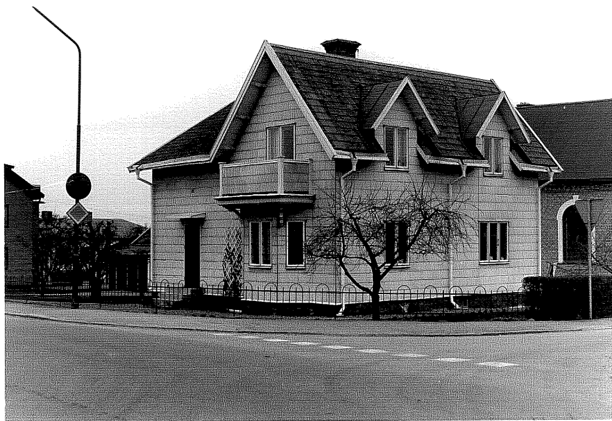
Bostadshus a fr.S0,4:13.

Ödeshög sn Tulpanen 2 Storgatan 28 foto:M.Wikdahl,1978.